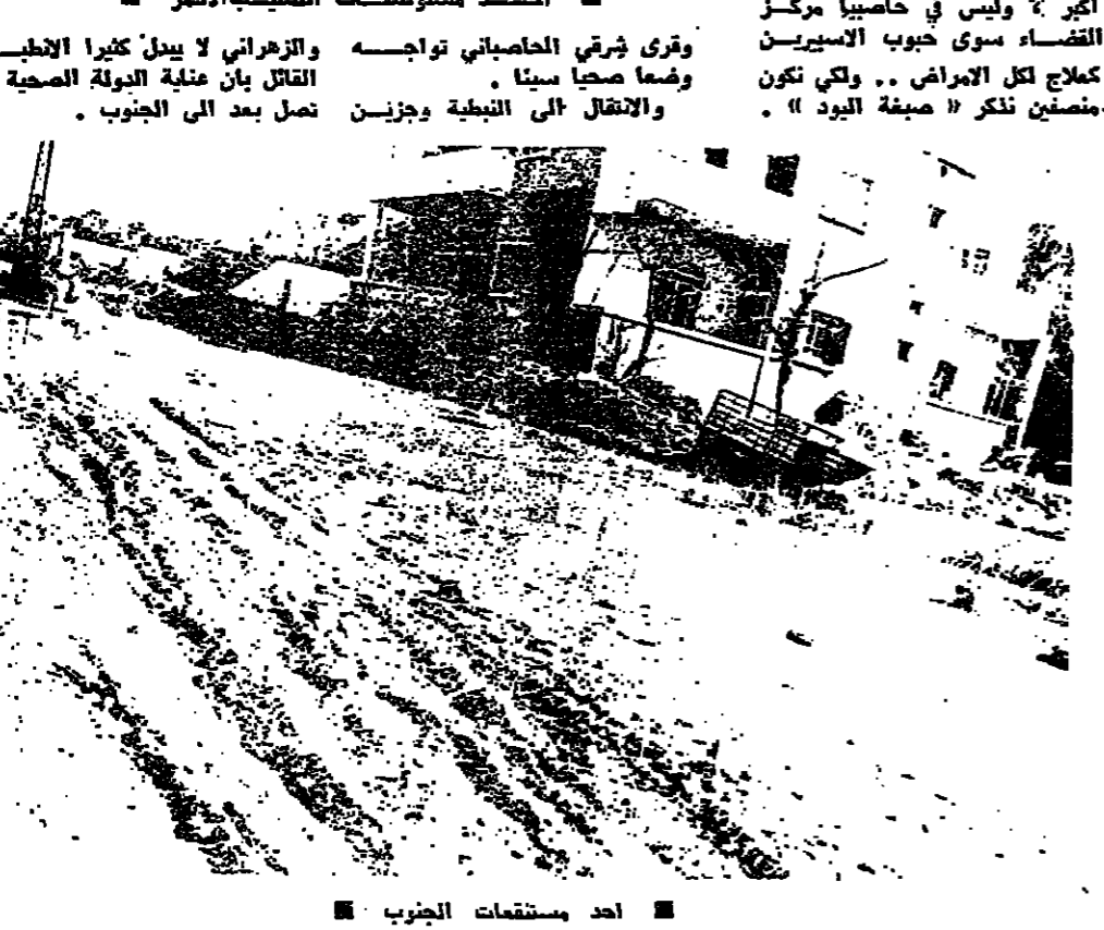
احمد مستوصفات الصليب الاحمر

كتب نزيه نوزري : بين تضاي الجنوب اللمة يبقى الوضع الصحي الاكثر الحاحاً ، خاصة في القطاعين الشرقي والوسط ومع « المزوج المضاد » الذي حصل خلال الاحداث وبهدسا ، تزداد الحالة تقيداً . وجولة سريعة في قطاعات الحدود وعلى ضفتي اللطاني كاتبة لكشف مقدار الفتن الاضح بالمنطقة على الصعيد الصحي . تبدأ بصورة المستشفيات الحكومية والخاص دورها مشلول تقريبا ، والحبوب البيضاء التي كانت توزعها المبادرات الثقالة لم تعد موجودة . من صور الى رأس العين ، الى مجدل زون خالقورة ، لا يوجد اي مستوصف رسمي او خاص . مستوصف التعاضد الاجتماعي يقفل في القفورة ، والمستوصف الوحيد المعامل بين صور ورميش هسو مستوصف علماء الشعب الذي يشراف عليه الصليب الاحمر اللبناني ، لكن خدماته محدودة ، بسبب الكثافة السكانية التي تعتمد عليه . في القطاع الاوسط والصحة اصعب ، وجميع المستوصفات التي كانت عمالة في الماضي متوقفة وعشرون قرية في العزوب يسلا مستوصف ، وكذلك في مرجعون ، والمستوصف النقال الذي اقتنسه حكومة الجزالي واقم في رأسيا الفشار بقي عكلاً دون حركة . وإذا كان هناك مجال المقارنة فان منطقة الحصاني تعاني مناعب اكثر ، وليس في حاصبيا مركز القضاء سوى حبوب الاسيرين . مقتل كل الامراض .. والتي تكون متضمنين نكر « صيغة اليد » .